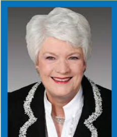
Ministre de l'éducation, l'Honorable Liz Sandals